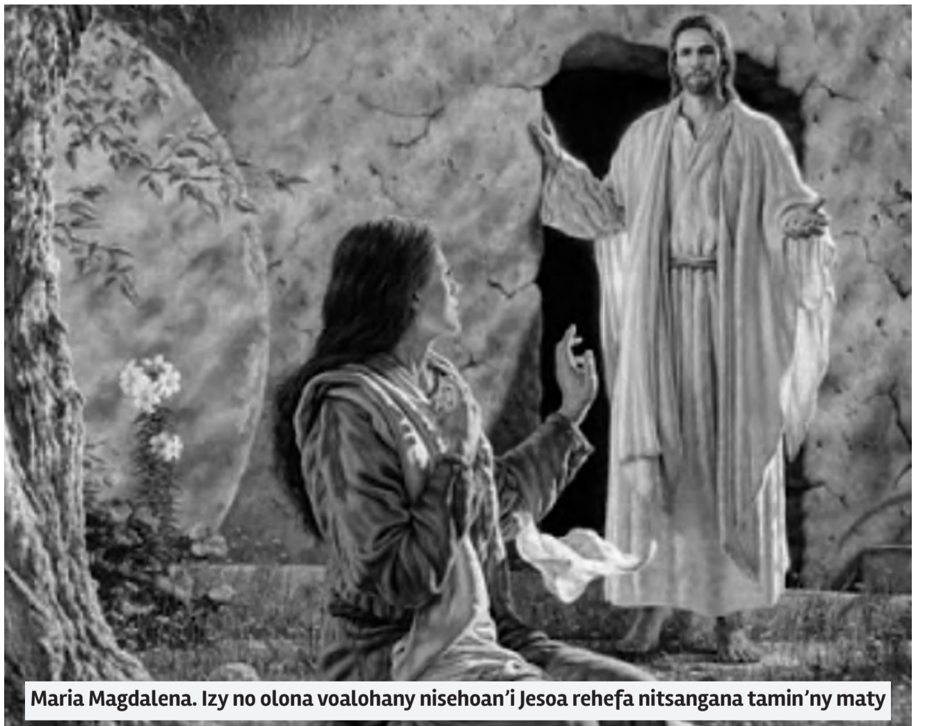
Maria Magdalena. Izy no olona voalohany nisehoan'i Jesoa rehefa nitsangana tamin'ny maty