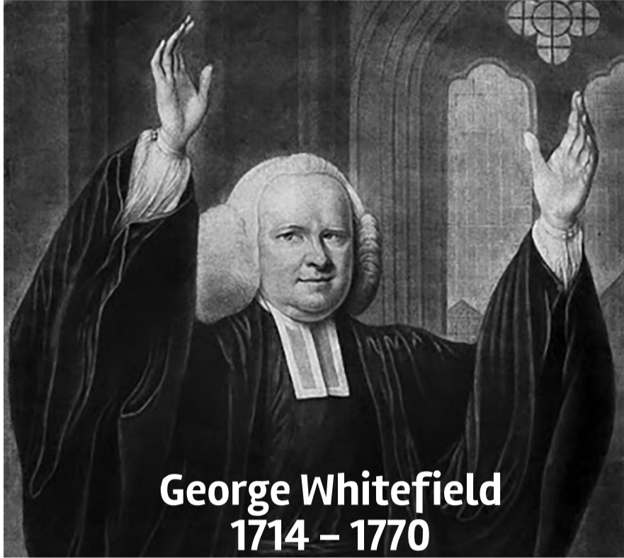
George Whitefield 1714 – 1770

Nampiasain'ny Tompo hitondra fifohazam-panahy tany Angletera tamin'ny taon-jato faha-18