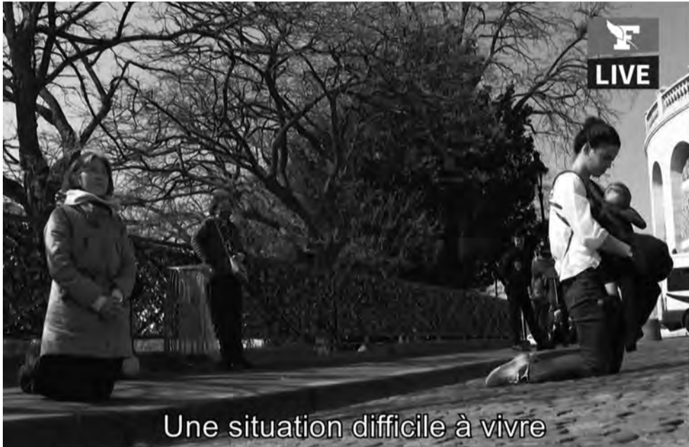
Une situation difficile à vivre

Tout comme Spurgeon, considérons les réunions de prière comme notre plus importante réunion.