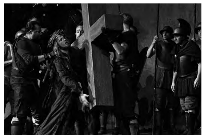
Les villageois d'Oberammergau jouant la Passion du Christ. A ce jour, zéro cas de contamination au Covid-19

En 1633, alors que la peste bubonique fait des ravages et décime près des trois quarts de la population, les habitants prient pour être épargnés par la maladie. En échange, ils promettent de jouer tous les dix ans le spectacle de La Passion du Christ. Aujourd'hui, le village est réputé pour ses représentations et accueille à chacune d'entre